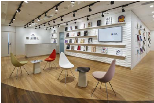
クライアントのデザイン本を多くディスプレイし、明るく広いエントランスとなっています。

ファッションとビューティに特化した多様な事業会社が同オフィスに集結したことで、個々の事業領域だけでは解決できないブランディングの本質的な課題を解決できるようになります。グループ各社がそれぞれ蓄積してきたノウハウや経験で協力し合うことで、クライアントニーズに沿って個々のサービスを改善し、新しいサービスを開発していく予定です。これまで、WMHグループ各社はクライアントの皆さまに支えられて成長してきました。これからもファッション業界とともに発展していけるよう、WMHグループとしてクライアントに寄り添いながら進化するべく、一層努力をしていきます。